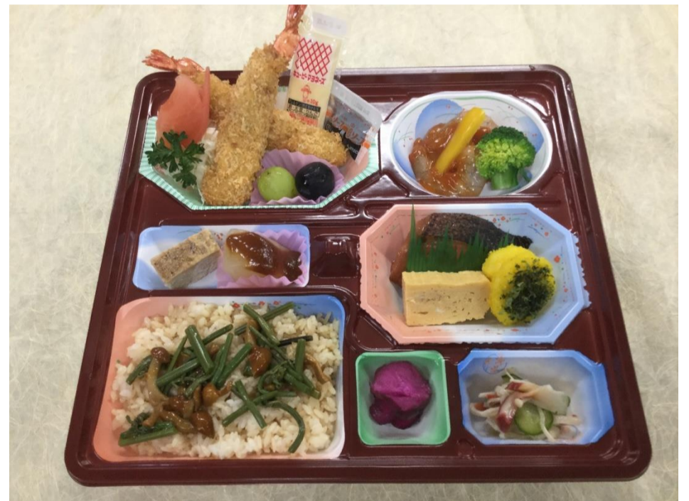
お弁当 (ききょう) 2,700 円