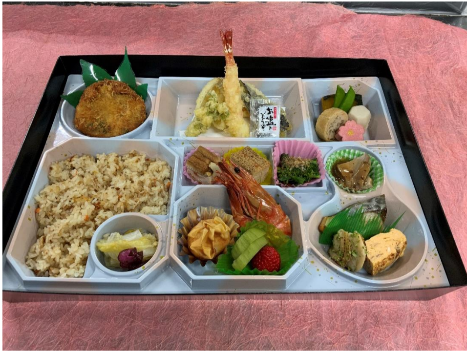
写真は 5,400 円です。