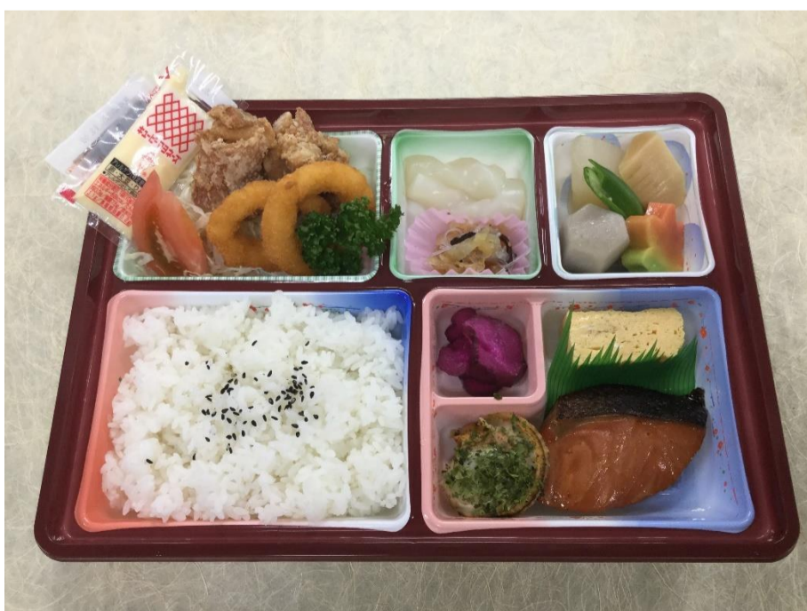
お弁当 (つばき) 1,620 円